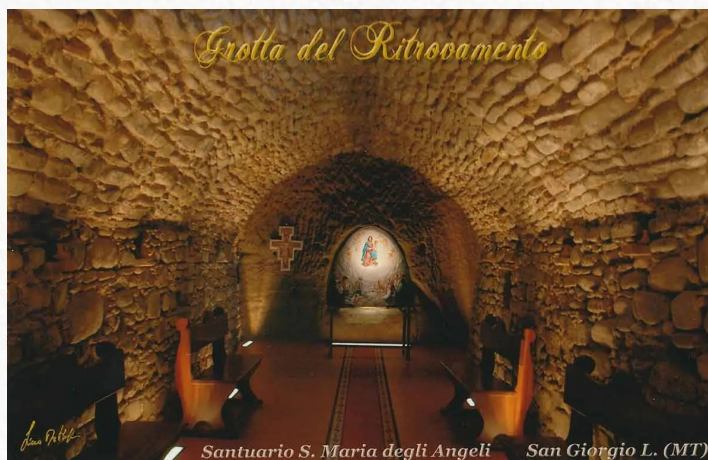
Santuario S. Maria degli Angeli San Giorgio L. (MT)